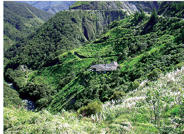
Research station in the Rio San Francisco Valley in Ecuador. Estación de investigación en el Valle del Río San Francisco en Ecuador.