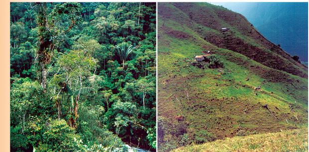
Challenge: Dwindling Biodiversity - Desavío: Biodiversidad decreciente