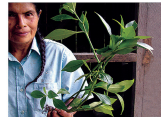
Shuar-woman recommending a wild grown Tsem-Tsem ( Peperomia sp.) as a medical remedy against stomach aches. Mujer Shuar recomendando una planta silvestre de Tsem-Tsem ( Peperomia sp.) como remedio contra molestias estomacales.

Sección transversal de una raíz de orquídea epífita que presenta hongos simbiotes en las células del tejido cortical.