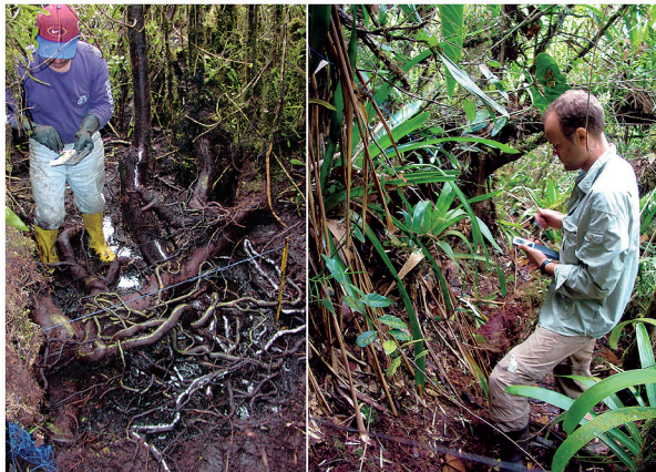
Agroingenieurs and botanists analyse root architecture, biodiversity and parameters of plant reproduction.

Our aim is to analyse the tropical mountain forest in Southern Ecuador in a multidisciplinary and comprehensive ecosystem study. Based on our understanding as of the functions of the ecosystem we want to elaborate options or sustainable use of the natural forest and possibilities to reforest abandoned agricultural areas with indigenous tree species.