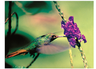
Cooperative interaction: Hummingbird pollinating a species of the Verbenaceae while sucking nectar.

El área de estudio en las laderas del Valle del Rio San Francisco esta ubicada entre las capitales provinciales de Loja y Zamora al sur del Ecuador. El rango altitudinal se extiende desde los 1200 hasta 3000 m sobre el nivel del mar. En esta área, se encuentran desde bosques prístinos hasta bosques en varios estadios de degradación, como también áreas con influencia del impacto humano tales como pastizales abandonados, sitios boscosos explotados, áreas de cultivos y huertos caseros.